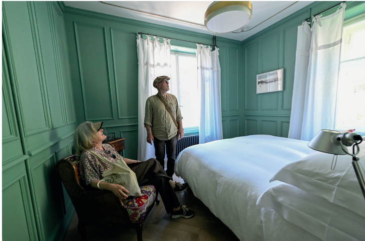
villa flor | s-chanf