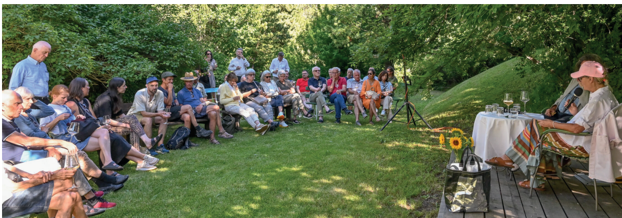
garten der chesa planta | samedan